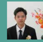
2024年度修了生 県内病院就職

私は遠距離通学だったため慣れるまで大変でしたが、同じ夢を志すクラスメイトと勉強や実習に励み、心強い先生方のおかげで充実した学校生活を送ることができました。ぜひ、専攻科へ入学して多くのことを学び、素敵な看護師を目指してください。