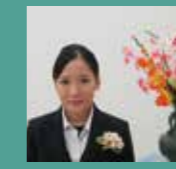
2024年度修了生 県内病院就職

私は本校の衛生看護科から専攻科に進学し、最短で看護師免許を取得できる道を選びました。専攻科では授業や試験、様々な分野の臨地実習、就職活動、国家試験の勉強など毎日が多忙で一日があっという間に過ぎる日々でしたが、2年間を乗り越えられたのは、クラスメイトや先生方、家族の支えがあったからだと思います。専攻科での2年間は楽しいことだけではなく大変なこともたくさんありましたが、クラスメイト同士で協力して支え合い、何事にも努力し全力を尽くすことで自分自身がとても成長できたと感じています。ぜひ、皆さんも魅力のある専攻科で学びを深め、楽しく充実した学校生活を過ごしませんか。