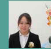
2024年度修了生 県外病院就職

私は本校の衛生看護科から専攻科に進学し、最短で看護師免許を取得できる道を選びました。専攻科では授業や試験、様々な分野の臨地実習、就職活動、国家試験の勉強など毎日が多忙で一日があっという間に過ぎる日々でしたが、2年間を乗り越えられたのは、クラスメイトや先生方、家族の支えがあったからだと思います。専攻科での2年間は楽しいことだけではなく大変なこともたくさんありましたが、クラスメイト同士で協力して支え合い、何事にも努力し全力を尽くすことで自分自身がとても成長できたと感じています。ぜひ、皆さんも魅力のある専攻科で学びを深め、楽しく充実した学校生活を過ごしませんか。