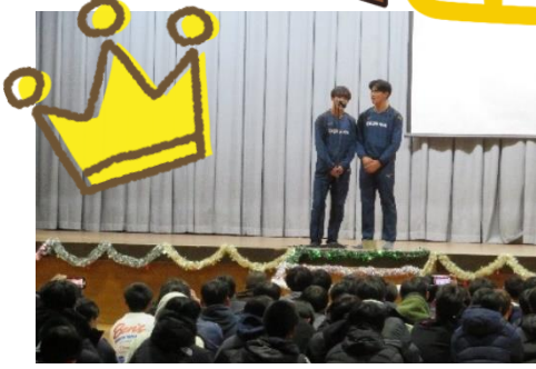
K-1グランプリ優勝者