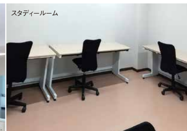
スタディールーム