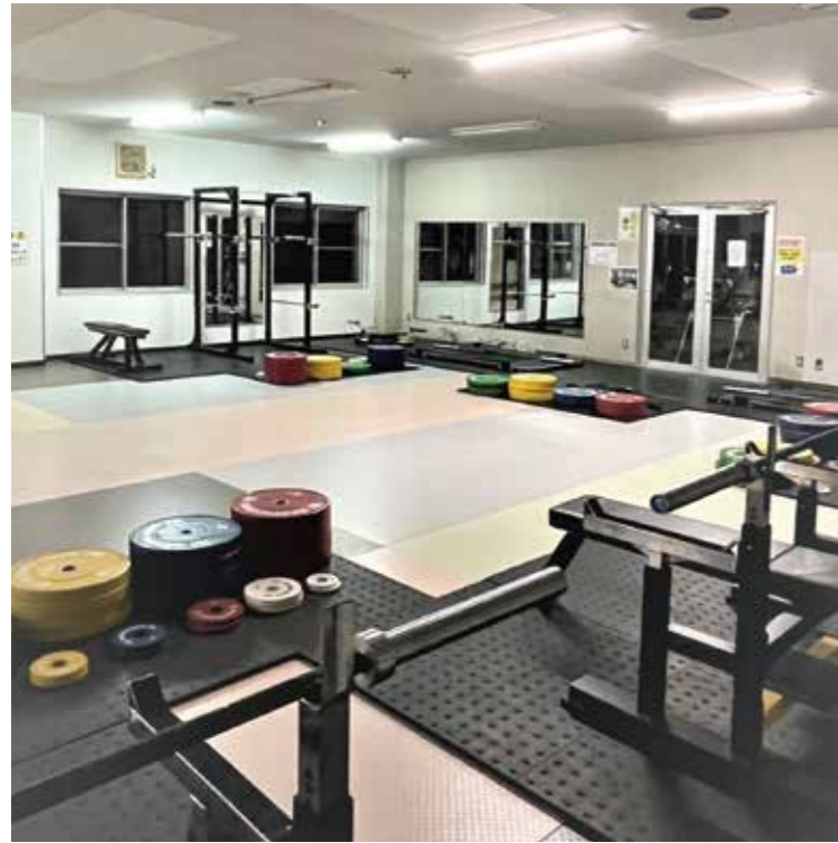
トレーニングルーム

寮生は運動部員が多いため、ボリュームのあるバランスの良い食事を提供しています。 また、怪我の予防とパフォーマンスアップを図るため、トレーニングルームも完備しています。